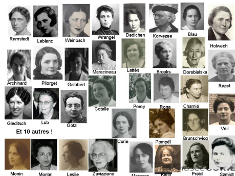
Zdjęcia kobiet, które pracowały w Laboratorium Marii Skłodowskiej-Curie